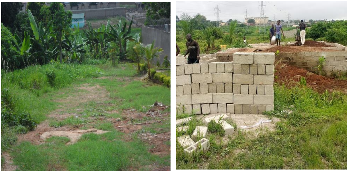
Planche 2 : Réduction des zones appropriées à la culture de la laitue ( lactuca sativa L.17.53)