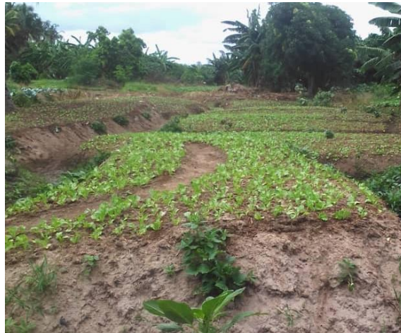
Planche 3 : Culture de la laitue à travers les zones humides de Daloa