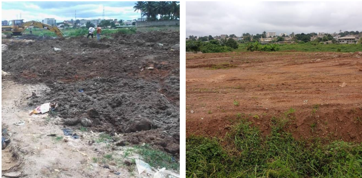
Planche 1 : Remblai des éléments physiques des versants des vallées de ladite ville