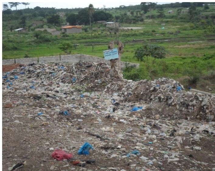
Photo 1 : Présence de déchets urbains entreposés dans les zones basses

A Daloa, l'inactivité des autorités administratives locales suscite le phénomène d'occupation des zones humides. En effet, avec les activités d'entretien avec les agents de la Mairie, il ressort que le cadastre de ladite ville n'indique aucuns indices de lotissements des infraèdres ou des cataèdres de certaines vallées. Ceux-ci laissent encore prospérer ces actes d'auto-appropriations d'un espace public. Par ailleurs, la dérisoire activité de ramassage des déchets urbains et le mécontentement des citoyens sous-tendent la présence des ordures ménagères dans l'essentiel des zones basses de ladite ville. D'ailleurs, avec la quasi-inexistence de réseau d'assainissement dans ces habitats spontanés (au niveau des métaèdres moyen et inférieur d'une vallée) et la présence de maisons précaires (au niveau des infraèdres ou métaèdre d'une vallée), des canalisations informelles conduisent les eaux domestiques et usées vers le lit mineur de bas-fonds (Photo 1).