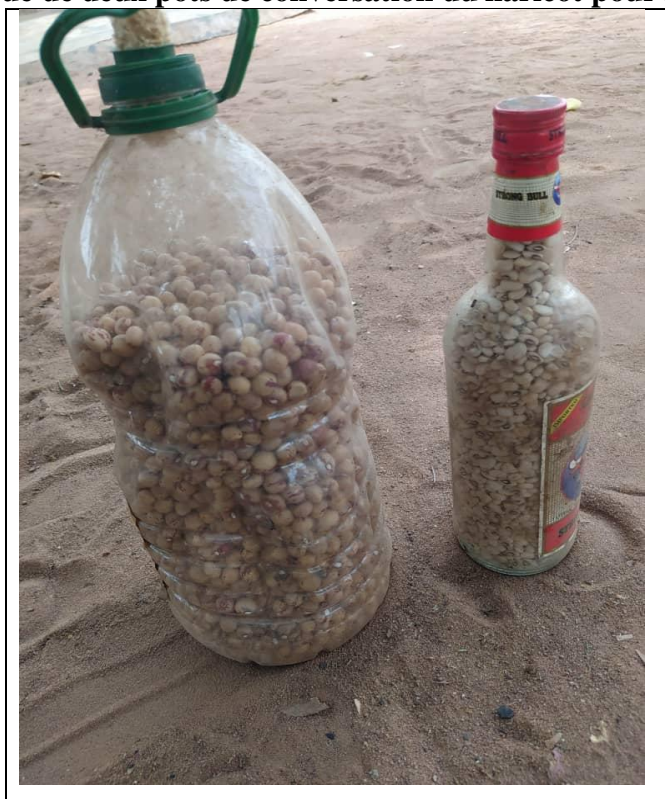
Photo 3 : Vue de deux pots de conversation du haricot pour les semilles

Il ressort de ces discours que les paysans Tagbana disposent également d'un savoir-faire agricole, qui leur permet de conserver une partie de la récolte des différentes cultures telles que le riz, l'igname, l'arachide, le haricot etc., pour la nouvelle saison culturale. En effet, les stratégies adoptées par les agriculteurs contribuent à la lutte contre la dépendance aux semences exportées, et dont l'accès est difficile du fait de la situation de vulnérabilité financière des paysans. Cette approche des paysans Tagbana s'oppose dès lors aux politiques diffusionnistes du changement technique, du « progrès » et du développement. Ces politiques s'inscrivent dans une démarche verticale et dissociative qui tend à privilégier l'usage de semences certifiées et, plus largement, d'intrants et d'équipement d'origine industrielle en substitution des ressources environnementales et cognitives locales. (T. LINCK et R. D'ALESSANDRO, 2019, p.5).